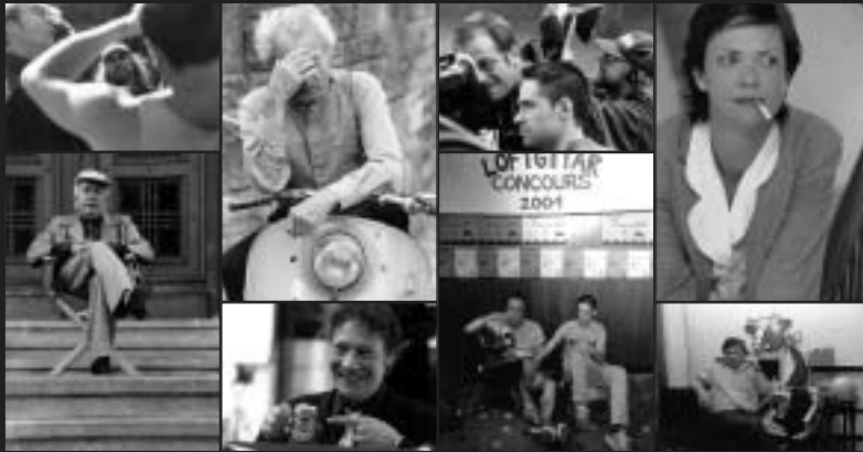
"Les joies du chômage au pays des cols blancs" Le Quotidien

"Schlechthin ein toller Film, echt gute Kinounterhaltung über Arbeiter und die, die es nie werden wollen" Tageblatt