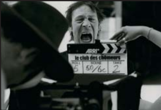
"Kurzum: Le Club des Chômeurs ist mit Abstand der beste und witzigste luxemburgische Film, der je gedreht wurde. Ansehen!!"